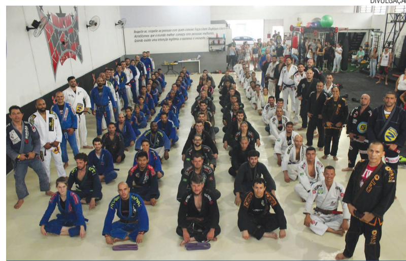
Cada aluno é acompanhado de forma individual de acordo com suas necessidades e desejos

A Fight for Life convida a todos para realizarem uma aula experimental para conhecerem o trabalho. Ela está na Rua São João, 380, na Vila São João. Para mais informações existem os números (19) 3704-1770, 99243-7202 e 99474-8615, e o site www.crispimteam.com.br .