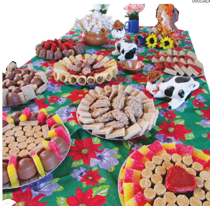
Os doces de amendoim são os preferidos nesta época do ano, além das cocadas, doces de leite, canjicas etc.