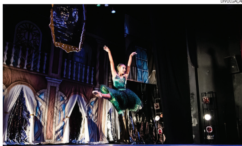
O ballet exige muita concentração na execução de cada movimento, o que aumenta o controle mental sobre o corpo e melhora a disciplina de cada praticante